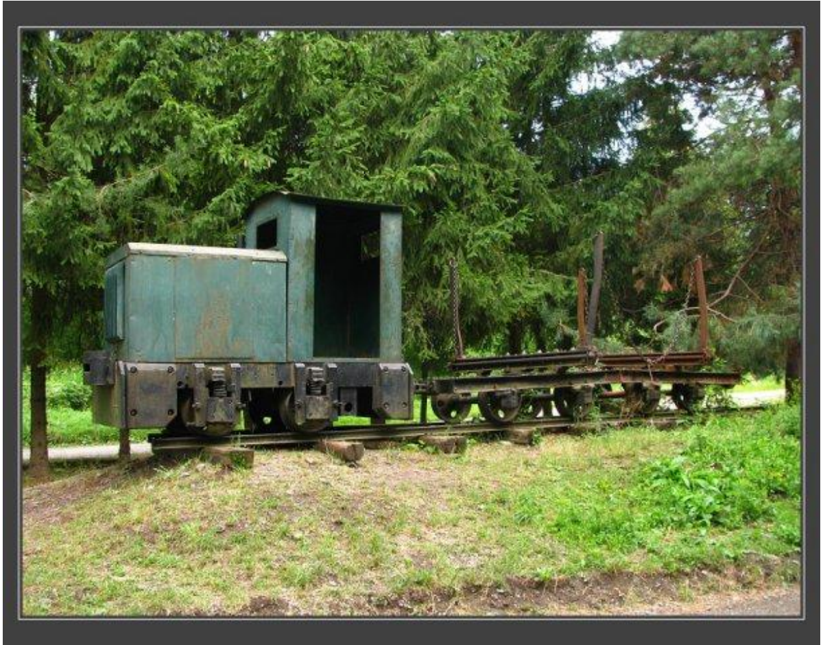
Podklady z obce