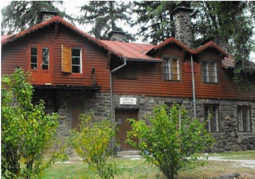
Podklady z obce

Ubytovacie zariadenia v obci sa nachádzajú Vila Kaštielik.